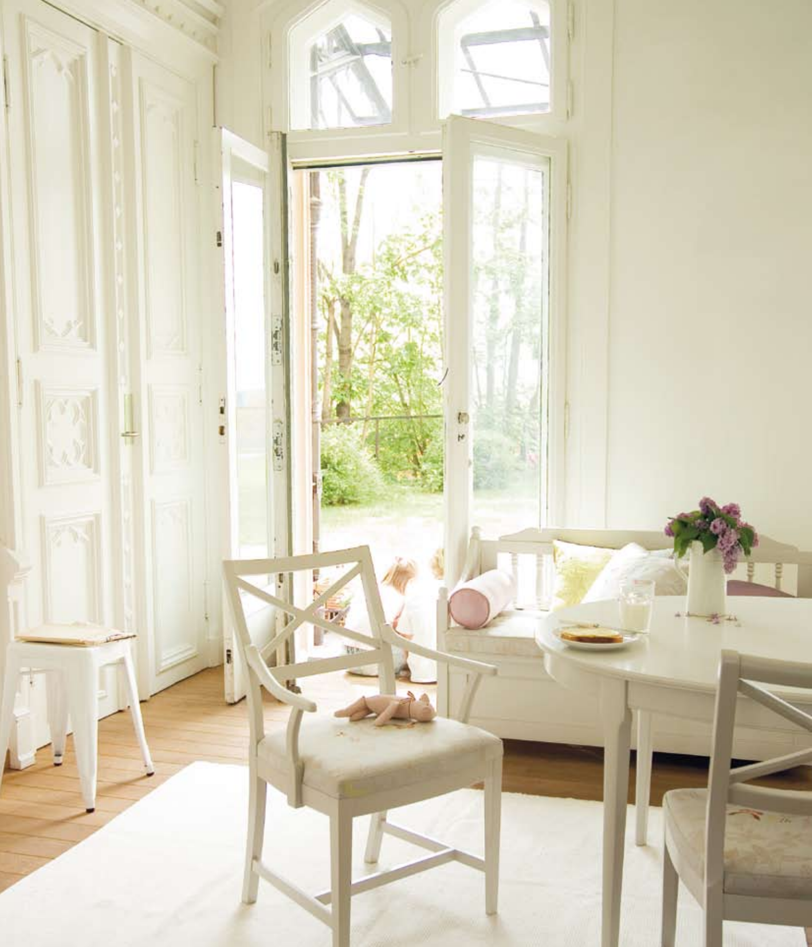
Eidsvold ovalt spisebord. Malt i farge: Sand. Uttrekk fra 4-8 innleggsplater á 50 cm. L:152 B:112 H:73,5. Sebastian småstol. Tekstil: Kenzo, 3548 Papili 01, Galet fra Peter Sveen. Malt i farge: Sand. B:48 D:55 H:87.