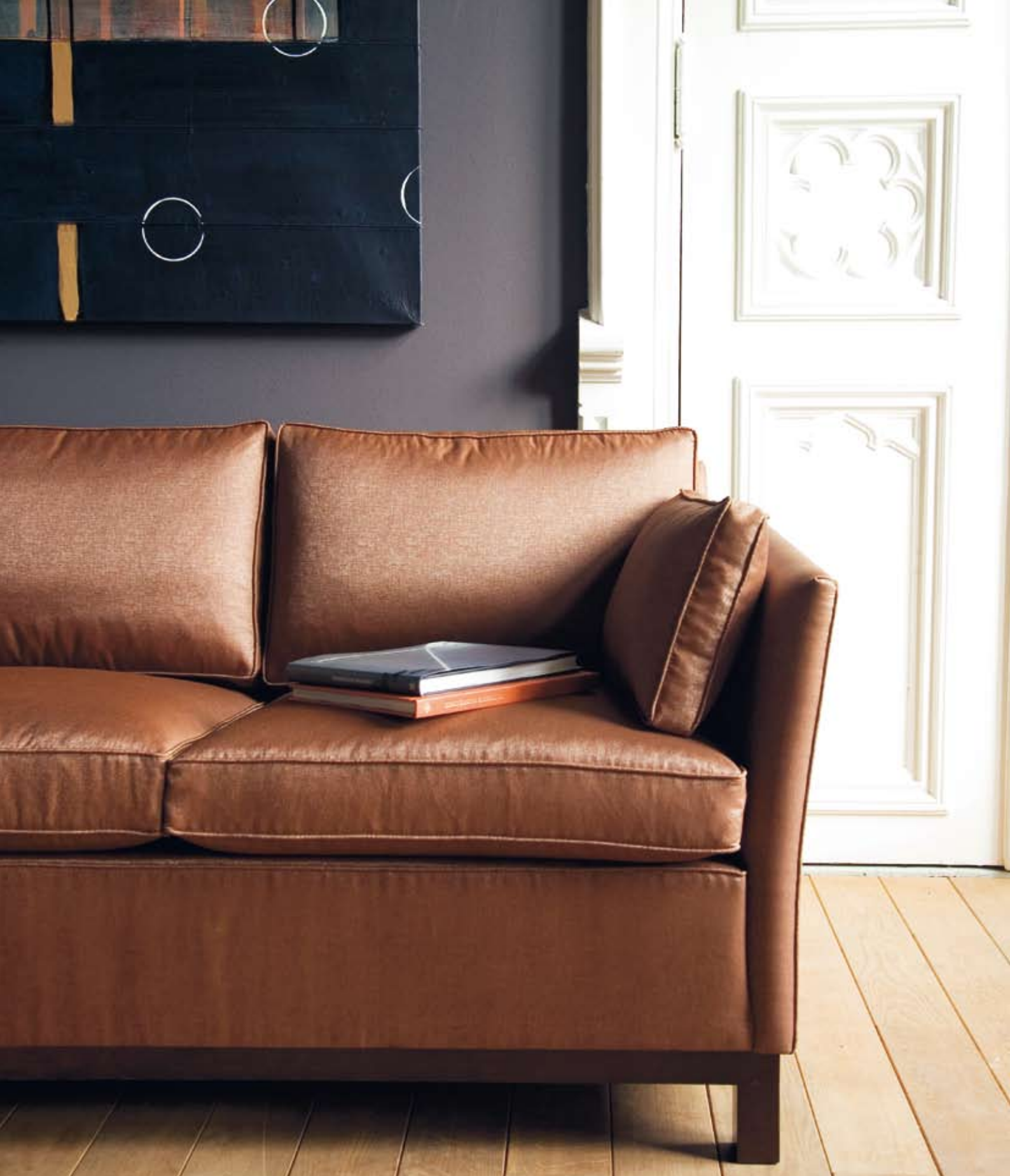
Vesletrim sofa. Tekstil: Warwick, Luminous, Tapas, Manhattan fra Peter Sveen. Leveres med kappe eller fotramme. Armbeskyttere som standard. B:211/165/146 D:80 H:75. Setehøyde 50 cm.