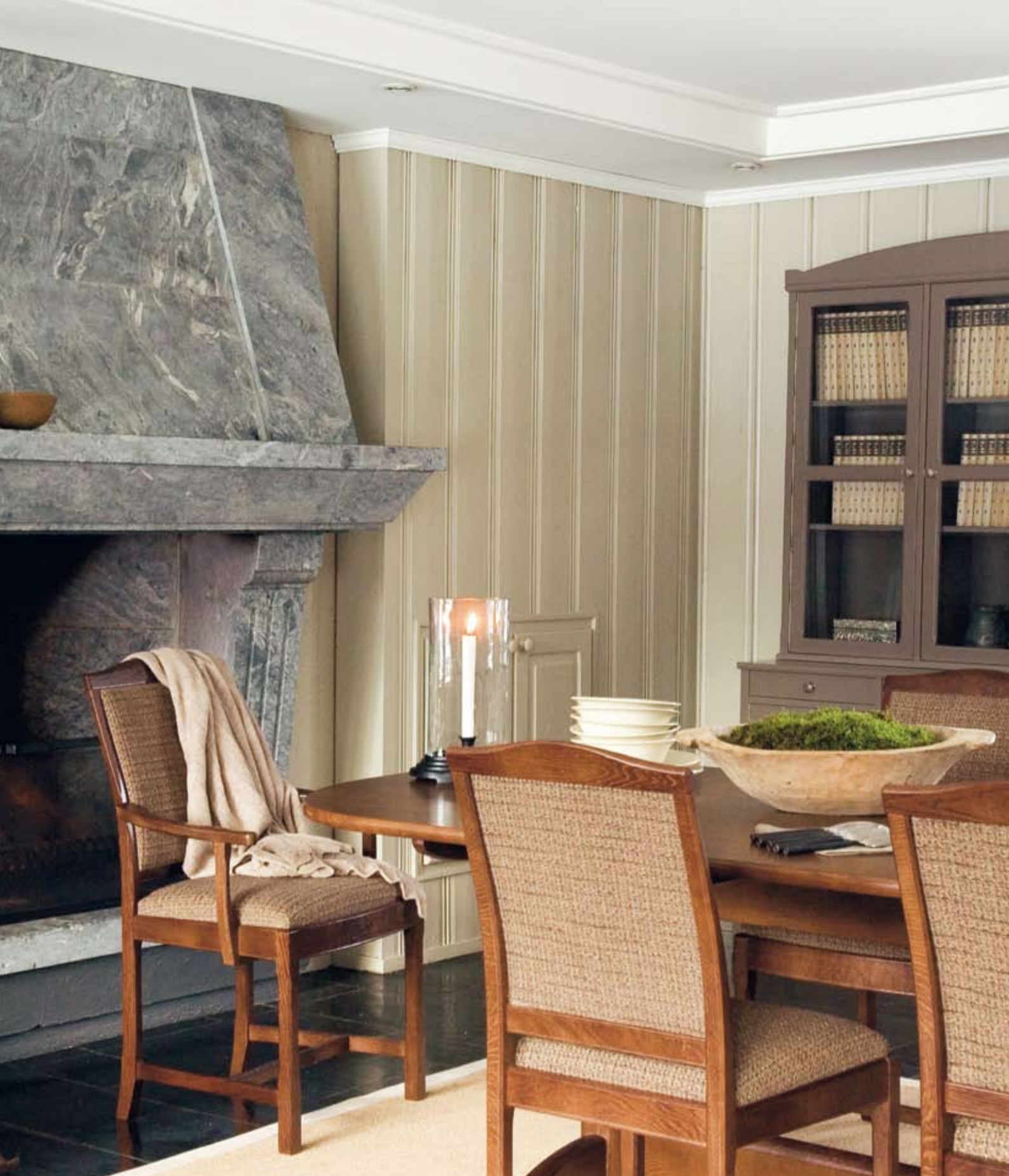
Eidsvold 3-delt skap m/finnknotter. Malt i farge: Jakt. B:130 D:51 H:200. Christiania langbord, beiset eik. L:250 B:100 H:72,5. Eidsvold småstol m/trukket rygg, beiset eik. B:47 D:54 H:92. Eidsvold armstol m/trukket rygg, beiset eik. B:55 D:56 H:92. Tekstil: ZR Coco 1290 887 fra Peter Sveen.