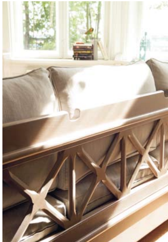
▲ Camilla dobbelseng. Camilla kommode/nattbord. Malt i farge: Sand. ▲ Hildur benk m/kiste. Malt i farge: Sand. B:165 D:56 H:80.