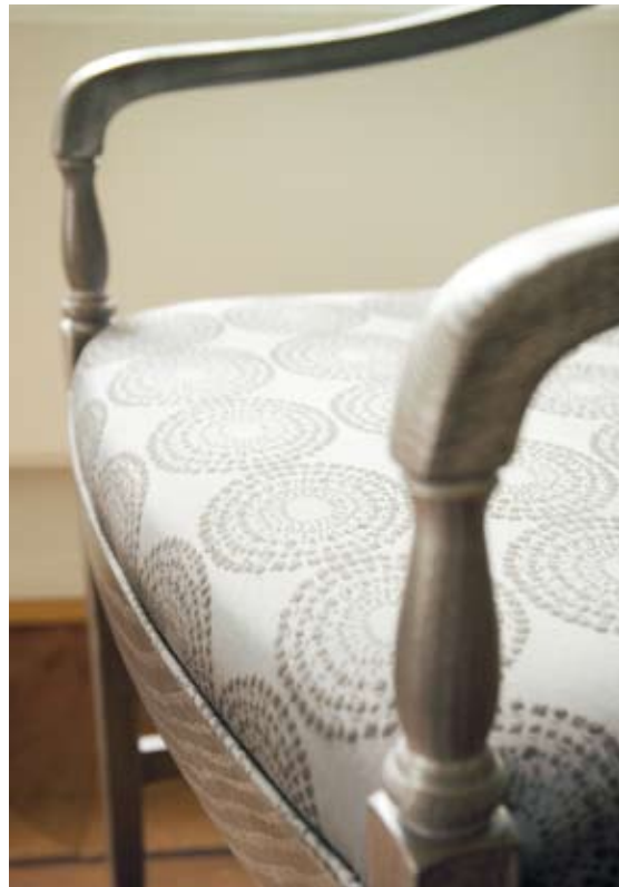
▲ Christiania skap i metallicbeiset eik B:93,5 D:53 H:207. Ammann armstol i metallicbeiset eik B:54 D:62 H:84,5. ▲ Eidsvold ovalt spisebord og Eidsvold småstol.