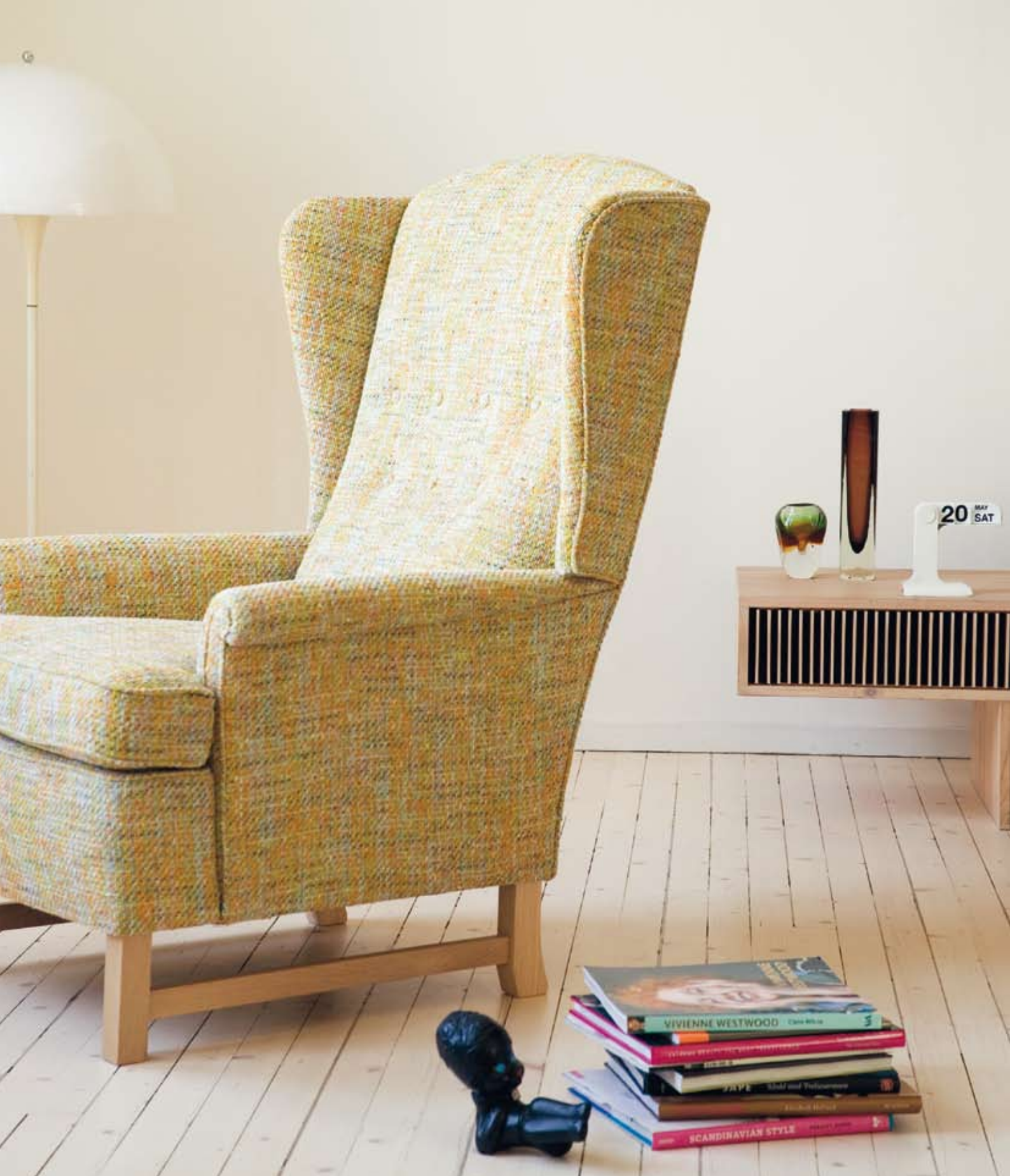
Philiphine ørelappstol u/kappe. Tekstil: ZR, Presario, 1285/713 fra Peter Sveen. Bein i ubehandlet eik. Armbeskyttere som standard. Leveres også med nakkepute. B:78 D:88 H:111.