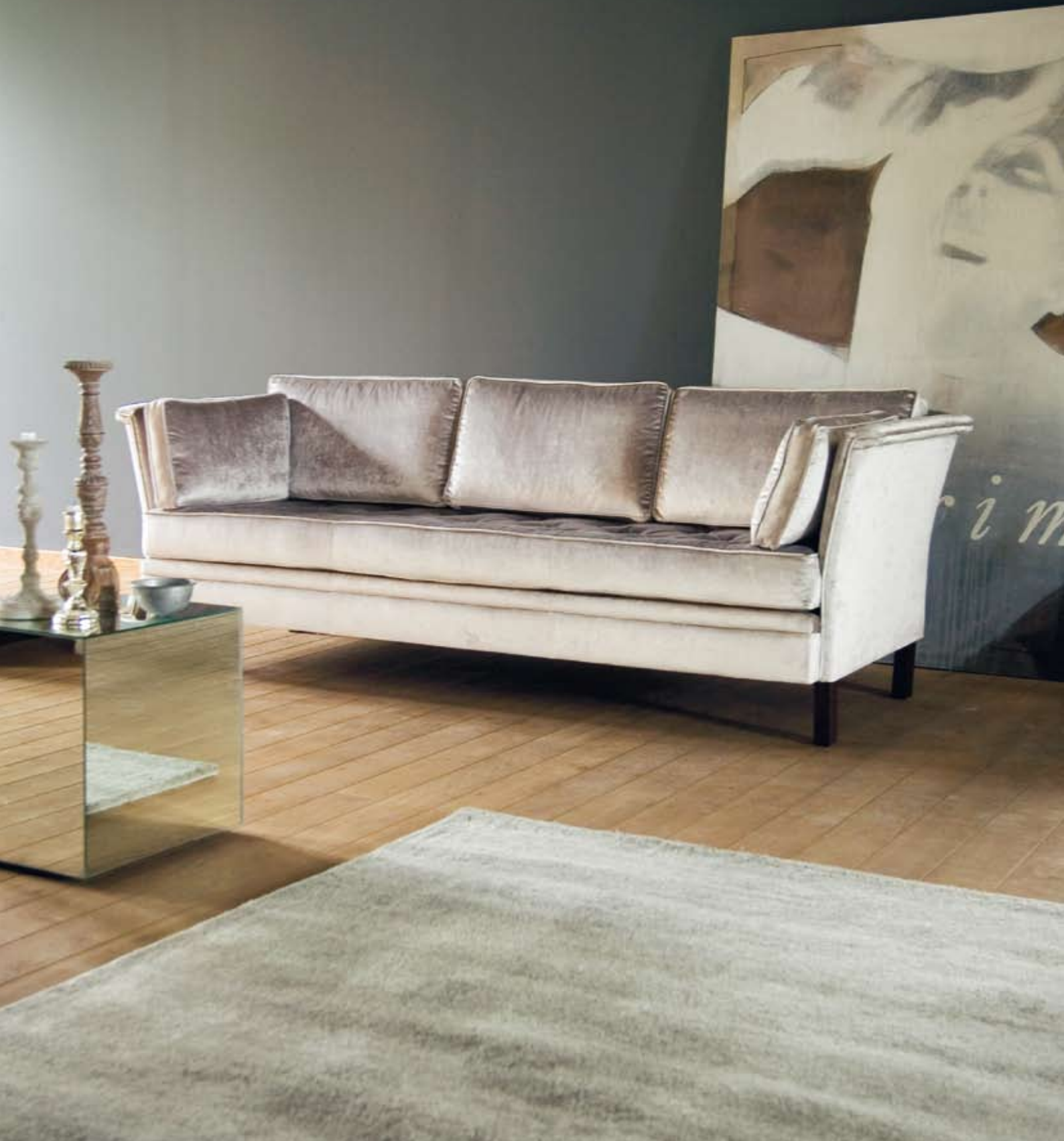
Trim sofa. Tekstil: Warwick Elegance, farge sølv fra Peter Sveen. Trim har hel vendbar setepute med knapper. Armbeskyttere som standard. B:220/185 D:80 H:75 Setehøyde 45 cm.