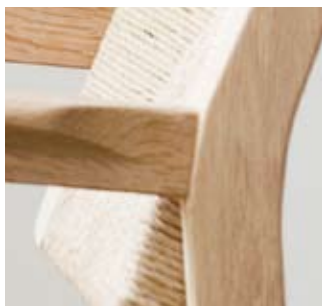
Møbler i heltre