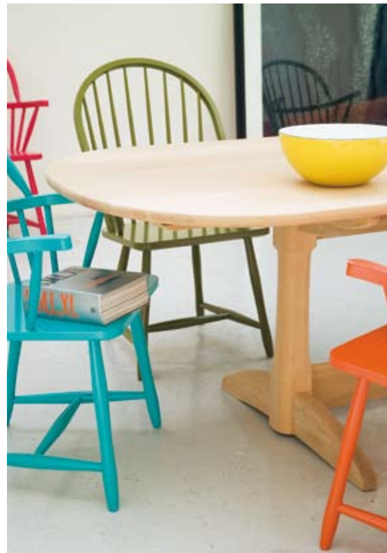
▲ Stol 1036 blir flettet i papirsnøre. Stolen er tegnet 1940 og ble innkjøpt til Kunsthindustrimuseet i Oslo 1943. ▲ Philipine ørelappstol u/kappe, bein i ubehandlet eik.